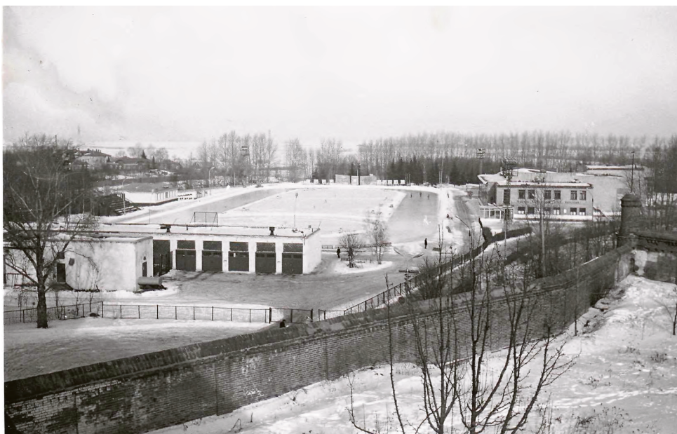
Шавыринская искусственная дорожка и Дворец культуры и спорта КБМ.