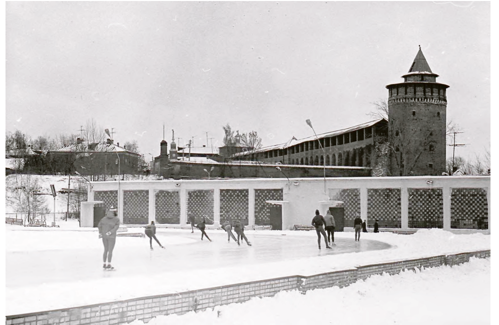
7 ноября 1968 г. Коломна. Первые тренировки конькобежцев на искусственном льду «Шавыринской дорожки».

скончался после операции в Центральной клинической больнице. Его смерть изменила не только темп строительства, но и планы великого конструктора. Отсутствие поддержки привело к тому,