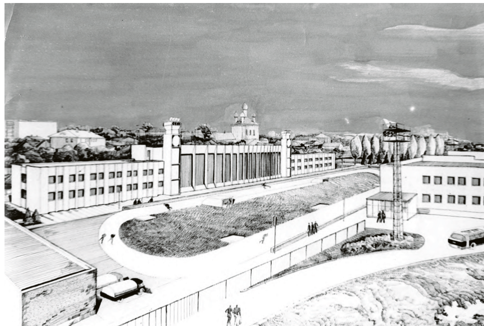
1964 г. Таким видел Б.И. Шавырин крытый комплекс с искусственной ледовой конькобежной дорожкой в Коломне.

Однако тем планам не суждено было сбыться. Накануне публикации в городской газете, 9 октября, Б.И. Шавырин