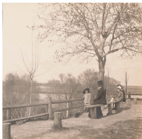
Берег реки Коломенки в 1907 г.