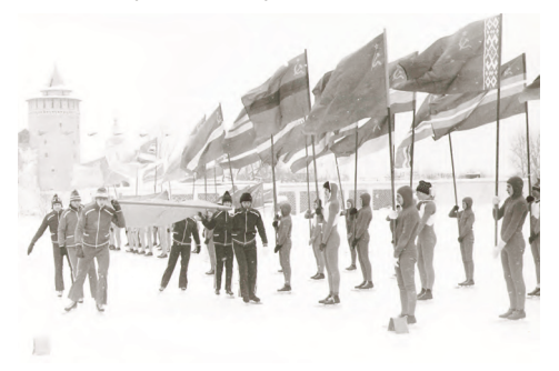
1985 г. Открытие 91-го чемпионата СССР по конькобежному спорту в Коломне.